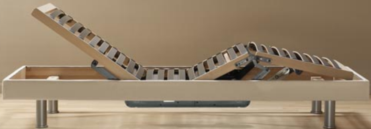
Bettbasis Selecta LC Buche massiv, Möbelstoff bezogen, 2-Matic

Selecta LC ist die Basis für gutes Liegen. „Lättli Couche“ nennen es die Schweizer liebevoll und meinen die elegante vielseitige Bettbasis mit integriertem Lattenrost. Sie lässt sich mit der Selecta Matratze Ihrer Wahl ausstatten und bietet durch die verschiedenen Varianten von mechanischer oder motorischer Verstellung ein zusätzliches Komfortplus. Eine Auswahl von Oberflächen, Fußvarianten sowie das Wandboard eröffnen individuelle Gestaltungsmöglichkeiten.