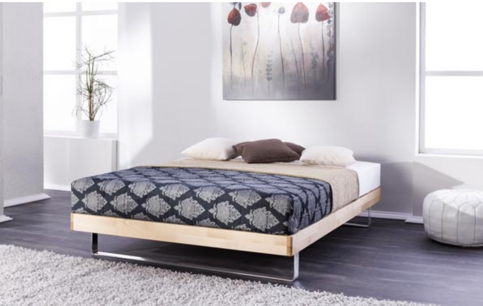
Bettbasis Selecta LC Buche massiv, Oberfläche mit Leinölfirnis veredelt