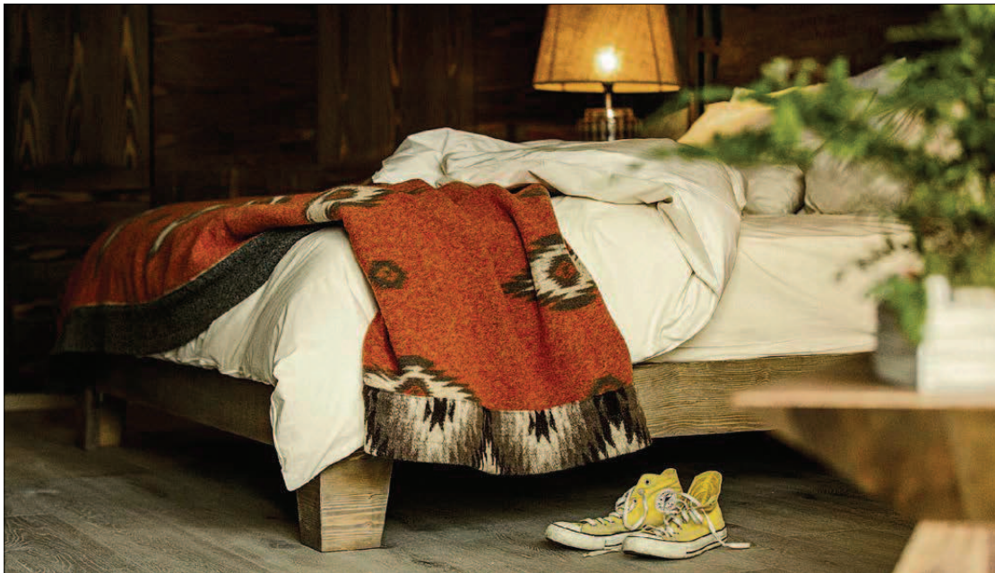
Der Kunde schätzt das Home-Feeling, ohne dabei auf Hotelstandard verzichten zu müssen. Serviced Apartments bieten genau das.