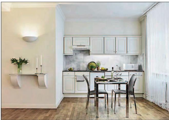
Ab Ende Jahr können Serviced Apartments von hotellerieuisse mit Sternen klassifiziert werden.